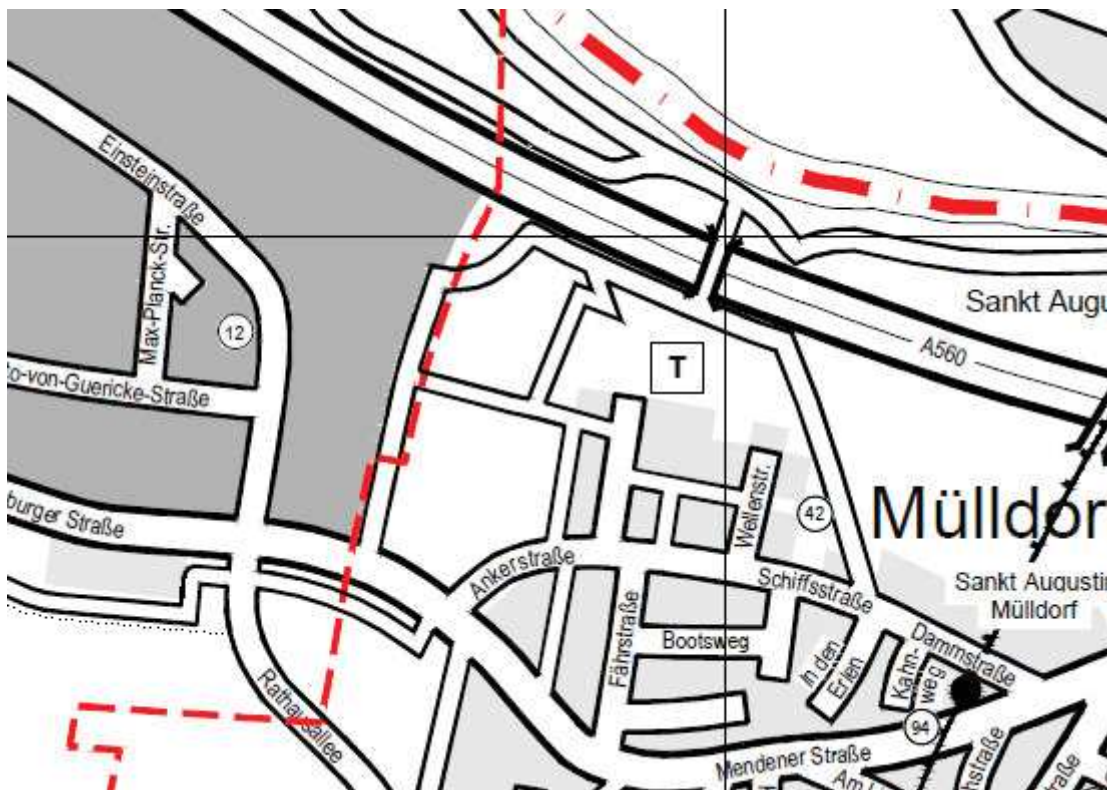
Abbildung 1: Karte des Jugendamtsbezirks 64 Ankerstraße